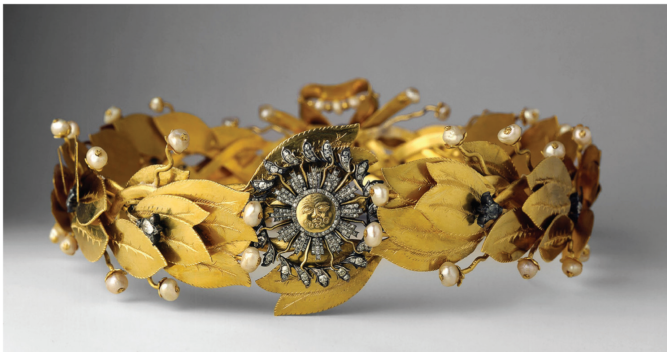
Figura 4. Corona de laureles de oro y perlas con la incrustación de un sol de brillantes. Obsequio de la Municipalidad del Cuzco a Bolívar en 1825.

Paradójicamente, el Cuzco, que había albergado por tres años a La Serna, el último virrey del Perú, recibió efusivamente a Bolívar, ciñéndole con una corona de laureles hecha de oro, con incrustaciones de brillantes y perlas, además de condecorarlo con una medalla también trabajada en oro (figura 4). Inclusive, su retrato sería incluido, por el pintor Marcos Chilli Tupa, en un biombo donde aparecía representada la dinastía incaica, rematando la serie Bolívar, con el rótulo “El Libertador del Perú” (figura 5). Se entiende entonces que, en una carta que el Libertador remitió desde el Cuzco a su compatriota y amigo, Fernando Peñalver, el 11 de julio de 1825, le expresara: “este país [Perú] está más tranquilo que Colombia y tiene por sus libertadores un respeto y una gratitud admirable”. 84