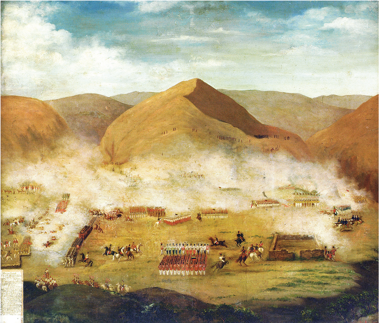
Figura 2. Batalla de Ayacucho. Lienzo de Teófilo Aguirre, circa 1825.

herido— además del general Canterac y los mariscales Valdéz, Carratala, Monet y Villalobos, entre otros (figura 2). Como se señaló anteriormente, Bolívar aseguró, celebrando la victoria: “Ayacucho es la desesperación de nuestros enemigos. Ayacucho semejante a Waterloo, que decidió el destino de Europa, ha fijado la suerte de las naciones Americanas”. Así, a pesar de la firma de la capitulación del ejército realista, España demoró en asimilar la noticia, achacándola, en un inicio, a fantasías de parte de los colombianos. Eventualmente, con la confirmación de la derrota del ejército del rey, se buscaron explicaciones y se trató de identificar culpables, hablándose incluso de una campaña de reconquista. 66