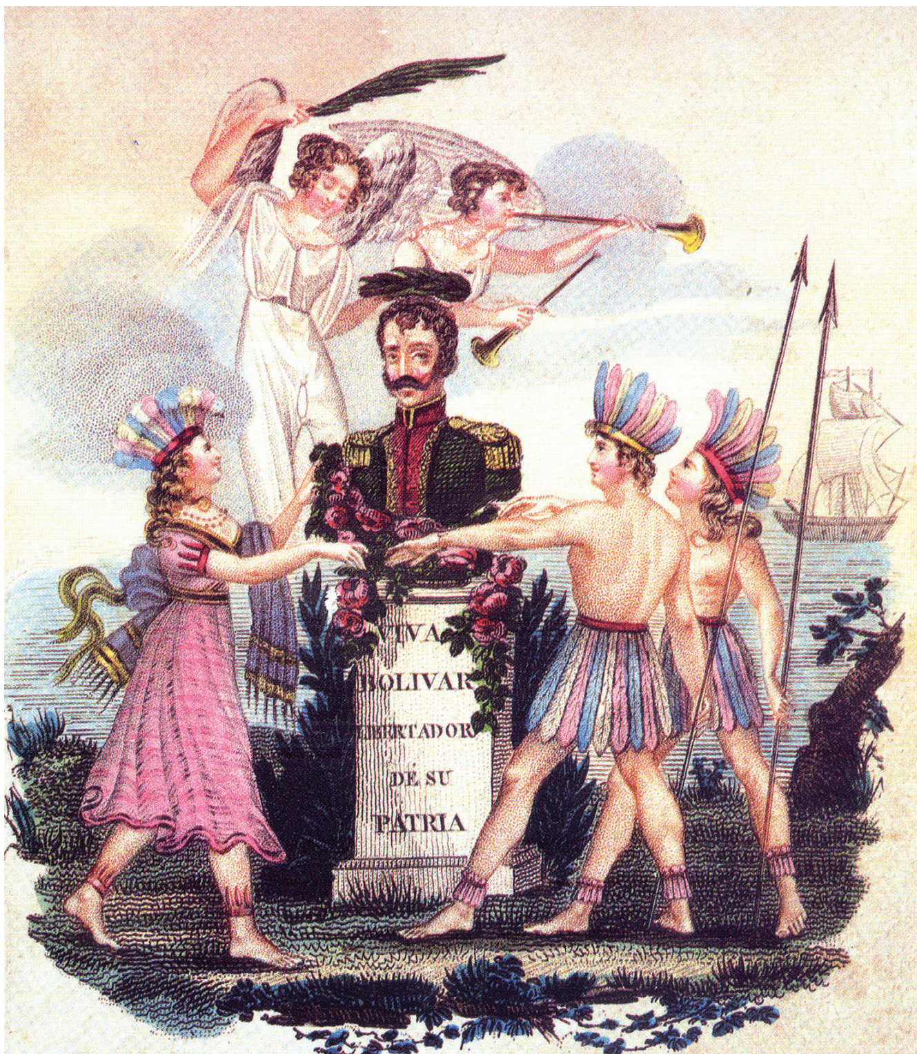
Figura 1. Canto a Bolívar. Ilustración de Joaquín de Olmedo a propósito de la victoria de Junín. París, 1826.