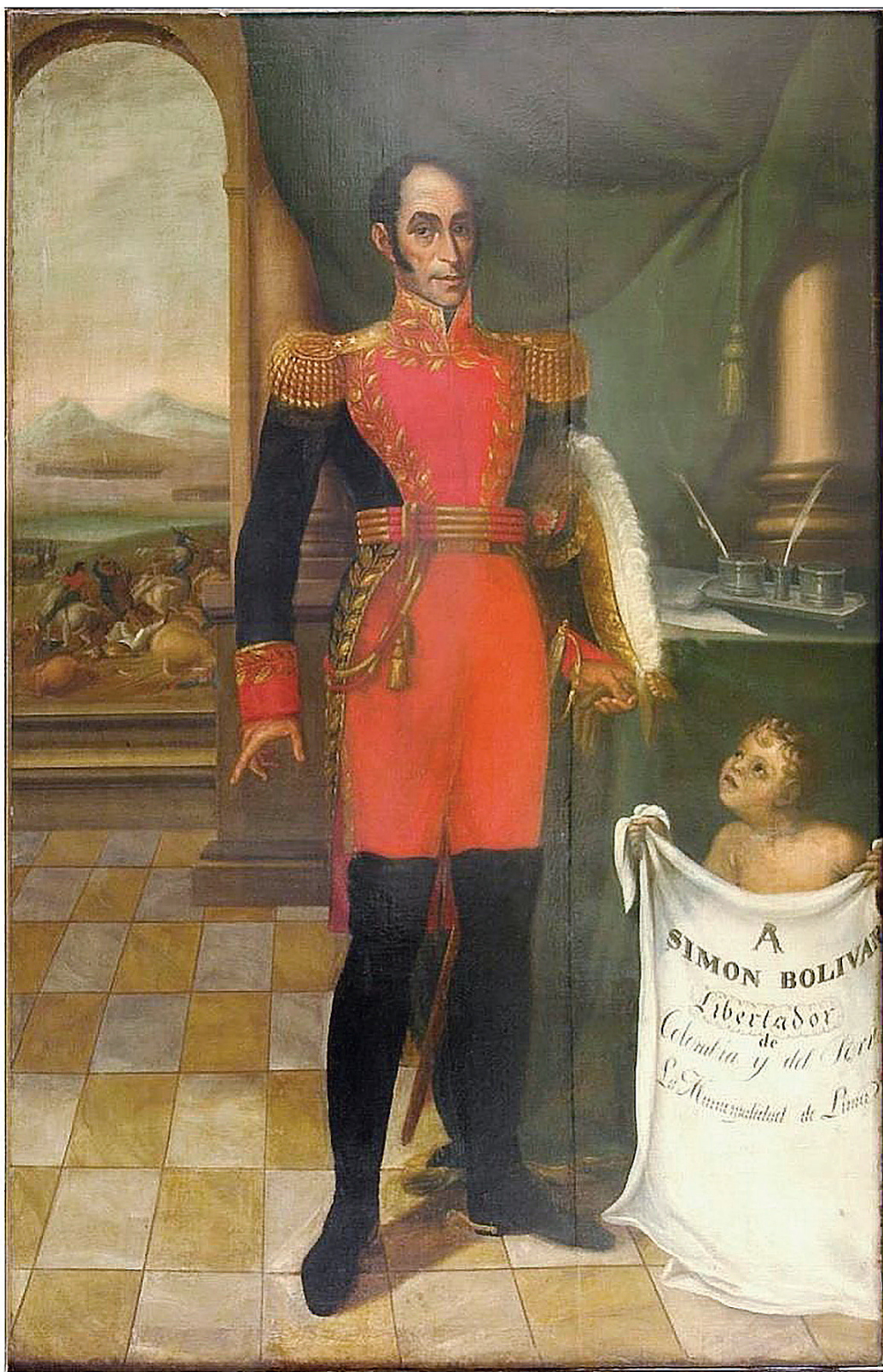
Figura 3. Retrato de Bolívar. Óleo sobre lienzo ejecutado por Pablo Rojas en 1825.