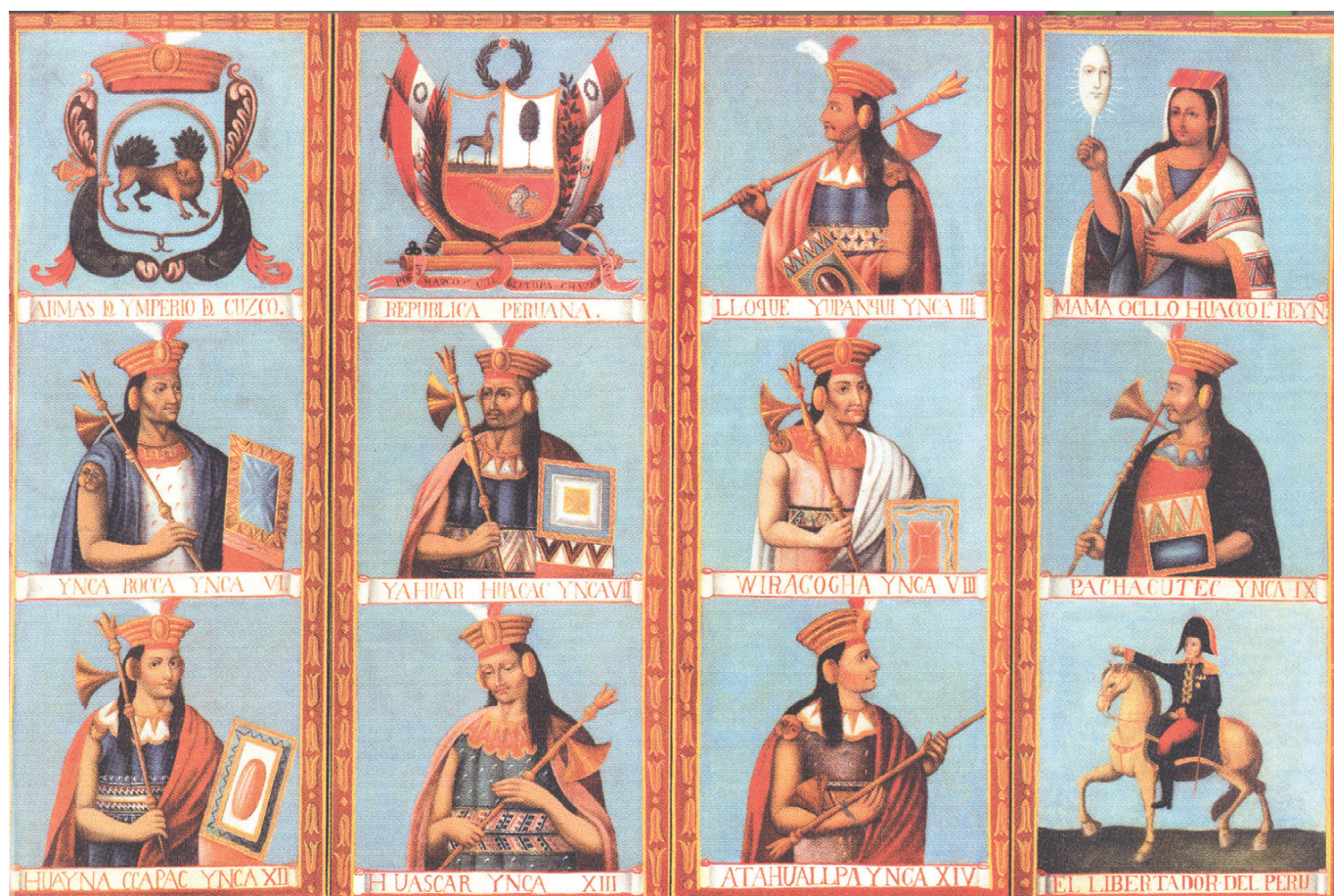
Figura 5. Biombo con la genealogía de los Incas (detalle). Obra de Marcos Chilli Tupa, 1837.