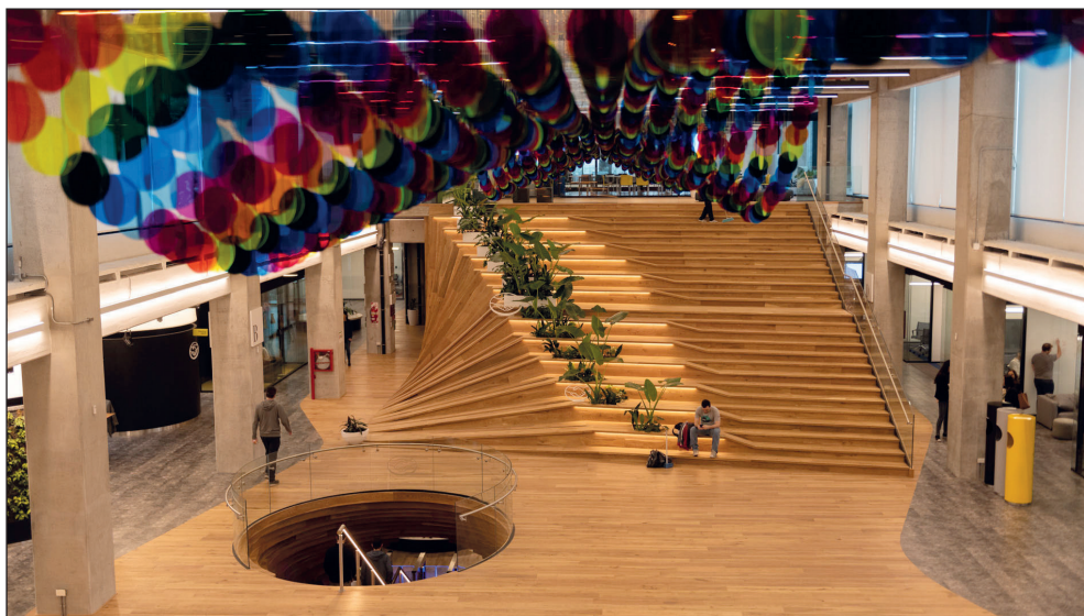
Imagen 2. Vista desde el primer piso de nuevas oficinas de Mercado Libre

Estas nuevas oficinas expresan de la mejor manera la visión del mundo que Marcos Galperin quiere transmitir a través de su empresa Mercado Libre. Se imponen como protagonistas de esta estructura espacial los “links o puntos de interconexión”, una gran escalera de madera en sintonía con una especie de hueco que conecta todos