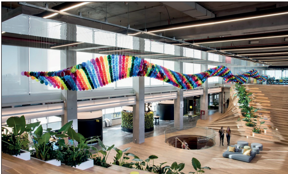
Imagen 1. Recibidor central de las nuevas oficinas de Mercado Libre en Buenos Aires

No hay rincón que no invite a la contemplación. Si se mira hacia arriba, se percibe una enorme estructura con pequeños círculos de colores que cuelgan desde gran altura, como puede apreciarse en la imagen 1.