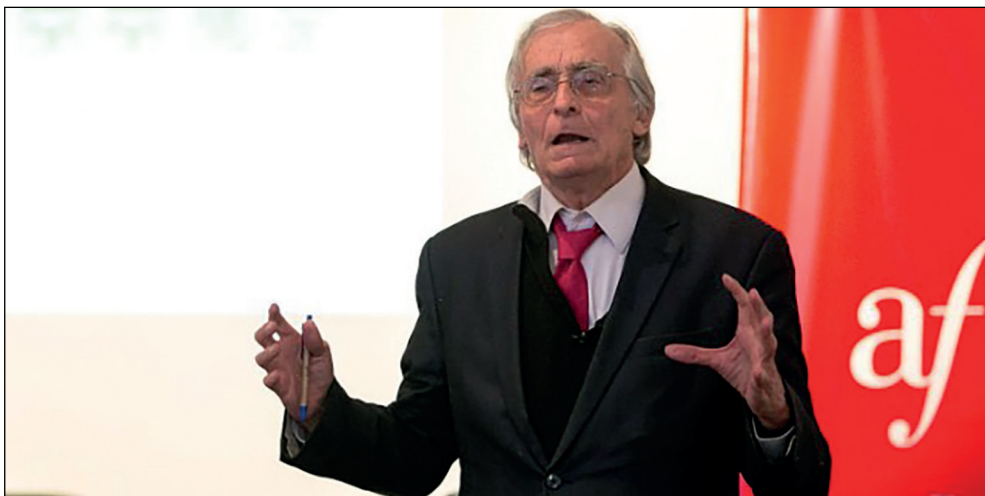
Robert Boyer.

Robert Boyer en el marco de las I Jornadas de Economía y Sociedad realizadas en la Universidad Nacional del Córdoba, en agosto de 2018. A continuación, se presenta una síntesis del intercambio del día 25 de aquel mes.