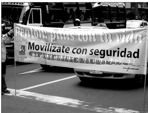
Imagen 3. Tránsito peatonal.