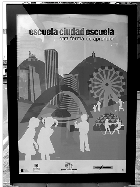
Imagen 1. Aprendizaje en la ciudad.

constituyó la base de la política de seguridad de Mockus. Él teorizó un marco pedagógico completo a partir de cinco distintas formas de comunicación que serían utilizadas al enseñar la cultura ciudadana, que incluían demostraciones de autoridad estatal que validarían normas legales, distribución de información sobre el contenido de la ley, ‘expresiones de racionalidad pública’, aprendizaje-enseñanza ‘dialéctica’ y comunicación simbólica, que incluía elementos de estética y acción dramática (Sáenz 2004, 26-7). Cada una de estas formas de comunicación buscaba convencer al “estudiante ciudadano para que desarrolle conocimientos, actitudes y comportamientos que el discurso estatal considerará conducen a la promoción de intereses públicos” y engendrar conformidad voluntaria con la ley (26-27). El estado también propuso el uso de comunicación indirecta en espacios que son “educativos en sí, debido a cierta disposición estratégica de espacio, tiempo, entidades y ambiente físico” (27), con lo que se amplió los esfuerzos de administraciones anteriores por hacer que la ciudad sea un lugar para aprender.