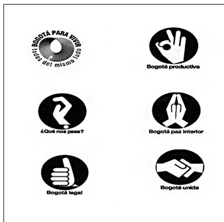
Imagen 2. Gestos de manos.

imágenes de ‘pulgares hacia arriba’ y de símbolos de manos con la señal de ‘ok’. Estos símbolos debían representar a una ‘Bogotá legal’ y una ‘Bogotá productiva’, a pesar de que la mayoría de gente simplemente apreciaba sus connotaciones positivas. Incluso las luces navideñas de diciembre de 2002 que colgaban sobre la plaza Bolívar simbolizaban una gran mano mostrando el signo de ‘ok’, mientras que otra mano similar se podía apreciar sobre Bogotá, descendiendo desde lo alto de Monserrate, la montaña que delimita la parte oriental de la ciudad.